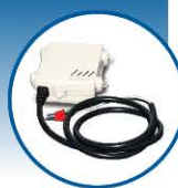
Z-REPETIDOR e Z-SERIAL