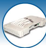
Z-TRI (Cliente e Trafo)