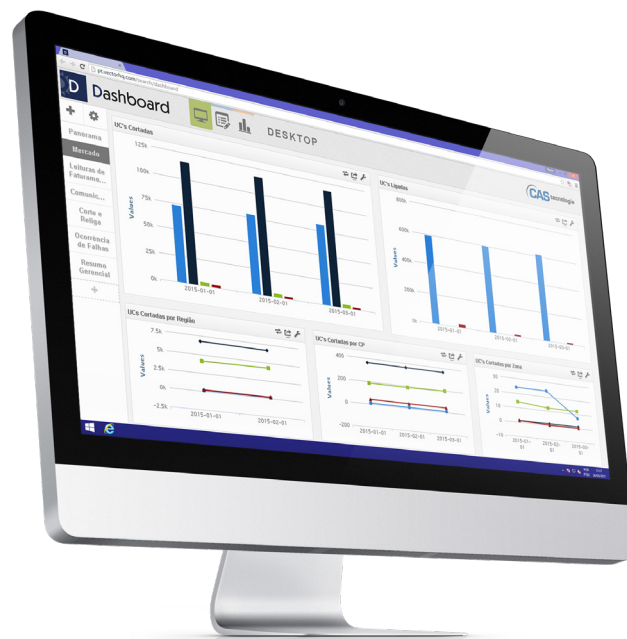
Acima: Gráficos de Mercado.

Fornecer o índice da efetividade para acompanhamento da performance de leitura para faturamento. O relatório comparativo confronta o número de leituras solicitadas com o número de leituras enviadas, possibilitando refinar a análise para encontrar possíveis falhas.